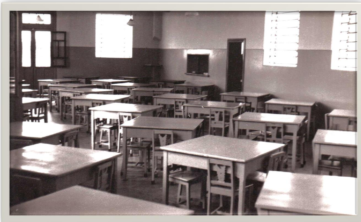
Mesas e cadeiras de madeira produzidas pelos próprios alunos