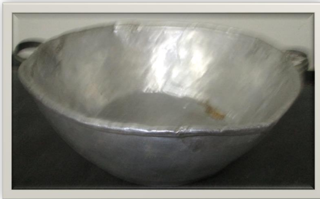
CAÇAROLA DE ALUMÍNIO, UTILIZADA PARA ACONDICIONAR VERDURAS, LEGUMES E LEGUMINOSAS