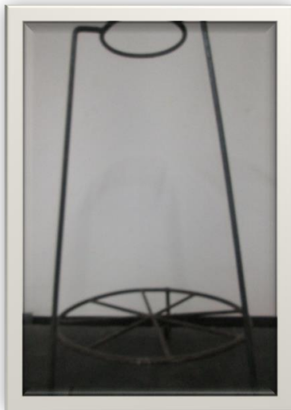
SUPORTE PARA COADOR DE CAFÉ