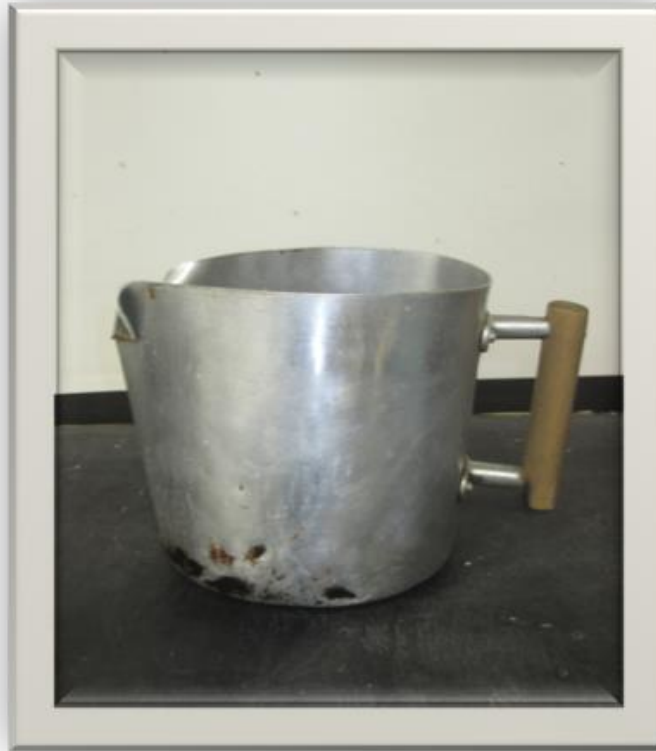
CANECA DE ALUMÍNIO PARA FERVER LÍQUIDOS