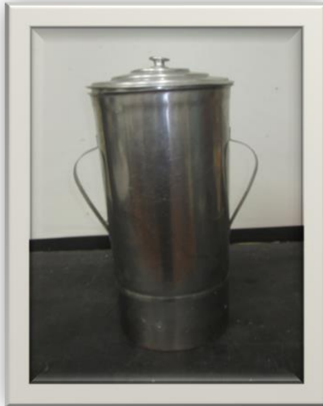
LEITEIRA DE ALUMÍNIO