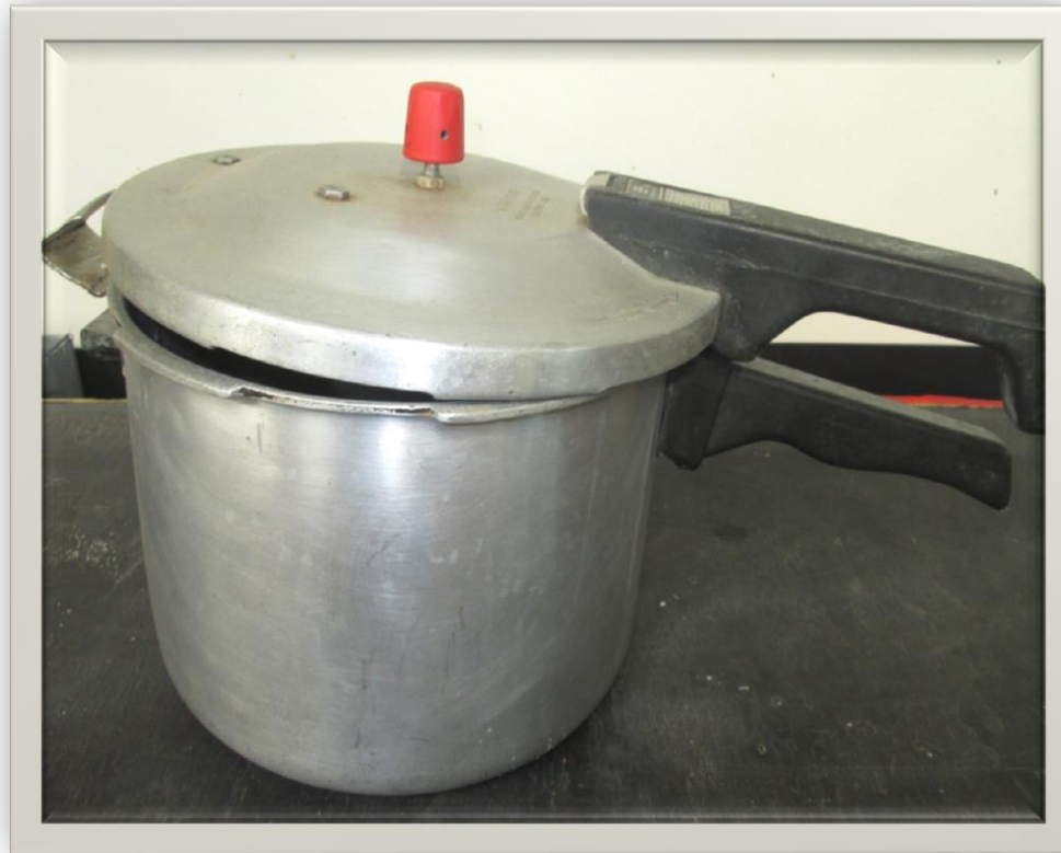
PANELA DE PRESSÃO INDUSTRIAL, DA MARCA EMPRESS